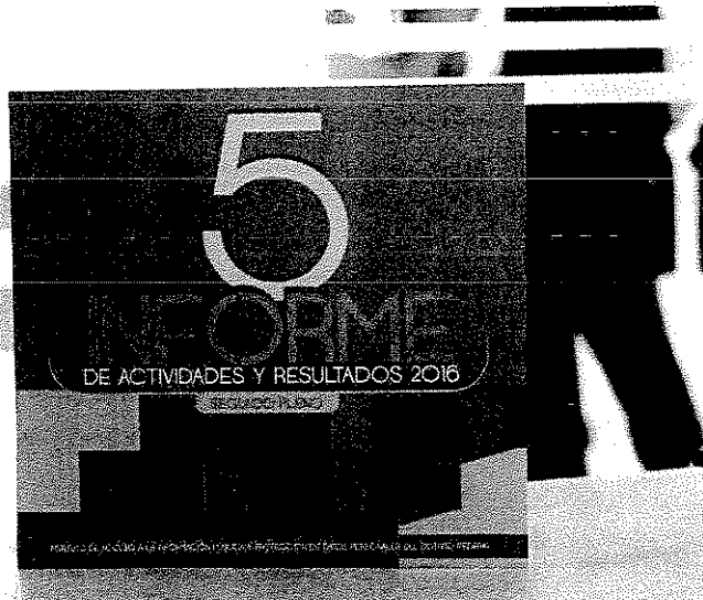
IMAGEN DEL FRENTE DEL INFORME