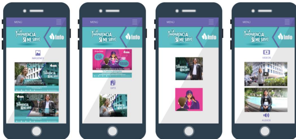
Vista de microsítio de dispositivo móvil