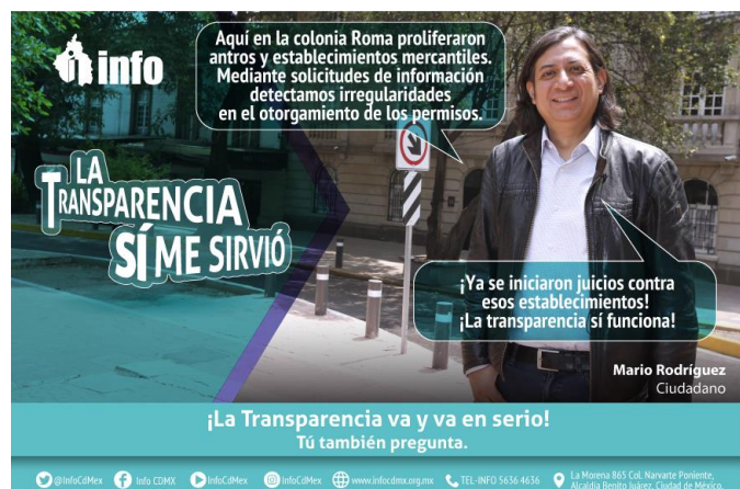
La Transparencia sí me sirvió, testimonio ciudadana