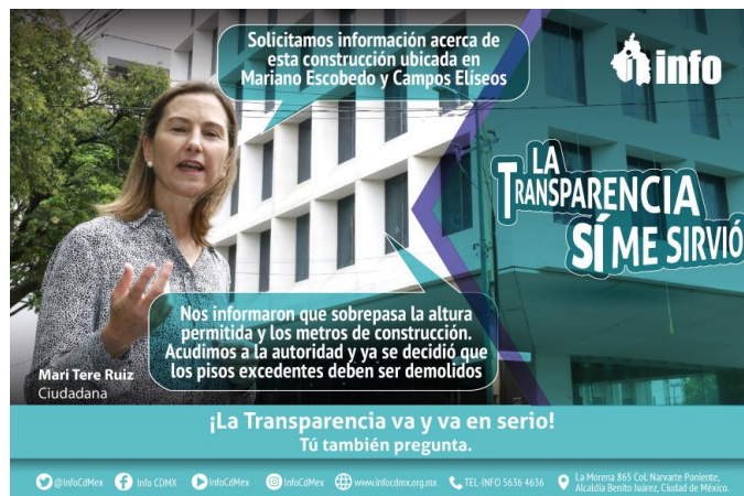
La Transparencia sí me sirvió, testimonio ciudadana

Durante el periodo, se realizó el diseño para la campaña institucional.